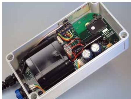
IP66 modell för installation ovan mark