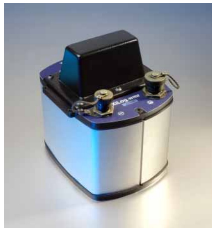
IP68 modell för installation under marken